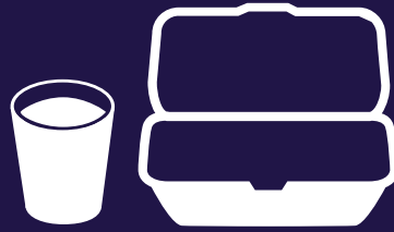
أدوات الطعام والأكواب المصنوعة من البوليسترين الممدد