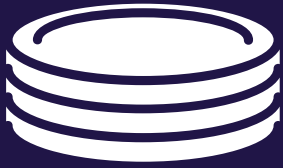
الصحون البلاستيكية لاستخدام واحد

تحظر هذه المواد البلاستيكية لاستخدام واحد في فيكتوريا