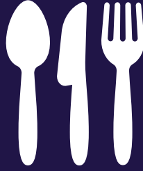
أدوات المائدة البلاستيكية لاستخدام واحد