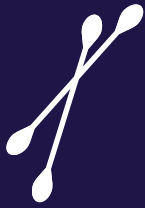
عيدان تنظيف الأذن القطنية المصنوعة من البلاستيك لاستخدام واحد