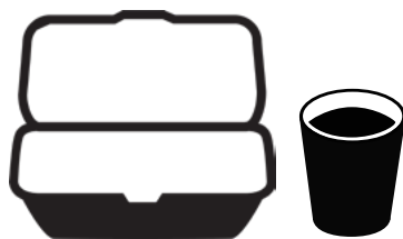
스티로폼 포장음식 용기 및 컵