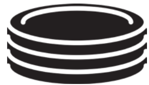
1회용 플라스틱 접시