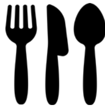
1회용 플라스틱 식기